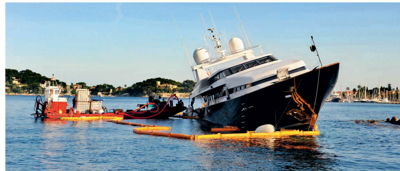
Grand Malheur: Eine Yacht ist in Südfrankreich auf einen Felsen aufgelaufen. Wurde alles getan, um den Schaden klein zu halten?

Unsere Rechtsordnung verbietet keine Selbstgefährdung und Selbstbeschädigung. Hier geht es vielmehr um die Verletzung einer gegenüber einem anderen oder gegenüber der Allgemeinheit bestehenden Rechtspflicht gegenüber sich